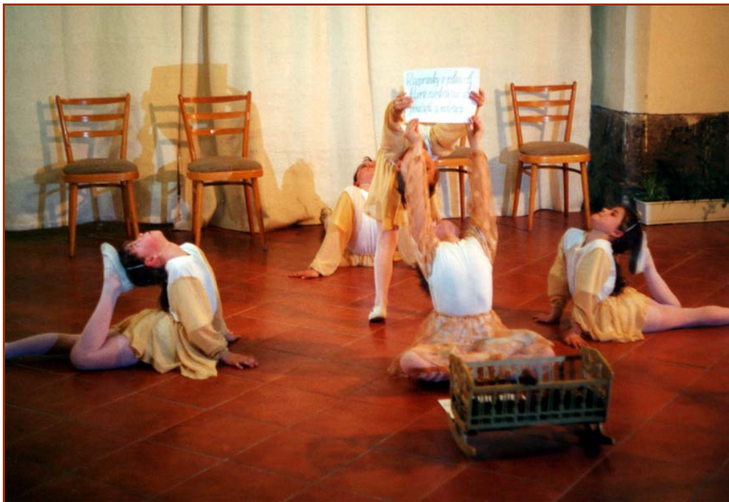
Ekobalet "Sudbinosne vile kod zmijske zibaljke", autor Anna Cehelská, Slovačka.

Najznačajniji rezultat studije je bila potvrda da obično pretpostavljena urođena i nepromjenljiva gadljiva odvratnost prema zmijama većinom preko 90% ustvari je posljedica imprintinga, to znači međugeneracijskim prenosom ponašanja u juvenilnom vremenu kad dete ne formira svoje reakcije na osnovu razumnih procesa, već podsvjesnim kopiranjem ponašanja roditelja ili drugih adulata. Brojni eksperimenti su i praktično potvrdili, da gadljiv odnos prema zmijama, koji je važna smetnja praktične aplikacije Zakona o zaštiti ugroženih vrsta, većinom je moguće odstraniti upotrebom optimalnih sredstava uticaja, a čak i promjeniti u izrazite simpatije. Sposobnost promjene podsvjesnog subjektivnog odnosa smanjuje se i teže se primjenjuje sa rastućim dobom obrađivanog pacijenta, na kojem se terapija aplikuje.